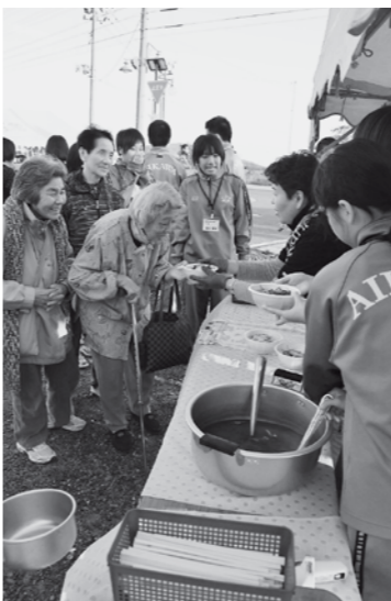
▲だまこ鍋の振る舞い

二日目には、山田町の小・中学生と、まとも火やだまこ鍋の準備をして交流。まとも火の供養式が始まる夕方には多くの人が訪れ、だまこ鍋やババヘアアイスに行列ができる盛況となりました。東日本大震災で亡くなった方の霊を弔う供養式が始ま