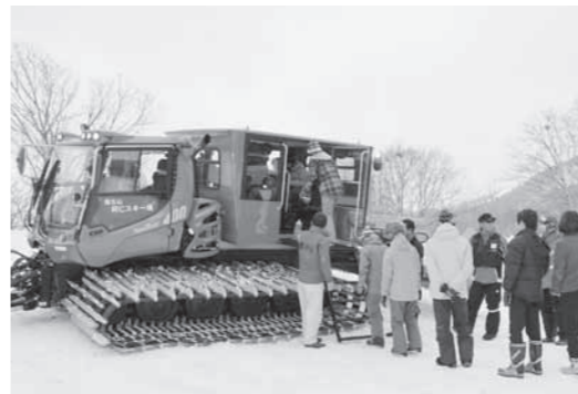
▲試乗体験で、圧雪車に乗り込むスキー客の皆さん

圧雪車はドイツ製。客室は車両後部に設置され、折りたたみ式のベンチシート、暖房、転倒時の緊急脱出口を装備しています。普段は客室を取り外してゲレンデの整備を行います。予約時には客室を付けて対応します。この圧雪車は、北秋田市と秋田県が本年度から協働で取り組んでいる「森吉山観光振興プロジェクト」の一環で導入しました。