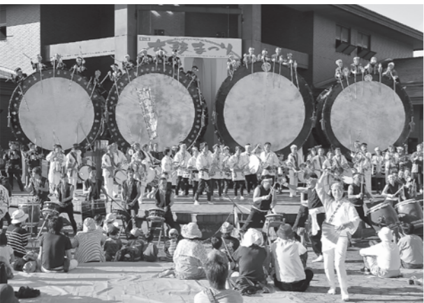
▲大勢の来場者でにぎわうたかのす太鼓まつり