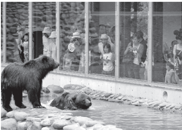
▲昨年オープンした熊牧場「くまくま園」のヒグマ舎