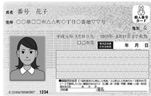
個人番号カード（表面）イメージ

なお、初回の交付手数料は無料ですが、紛失などによる再交付の手数料は、有料となります。