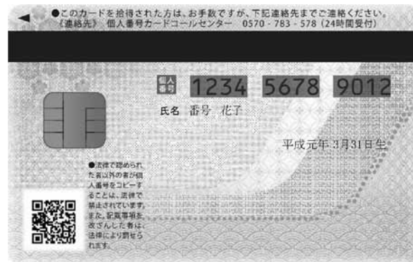
個人番号カード（裏面）イメージ