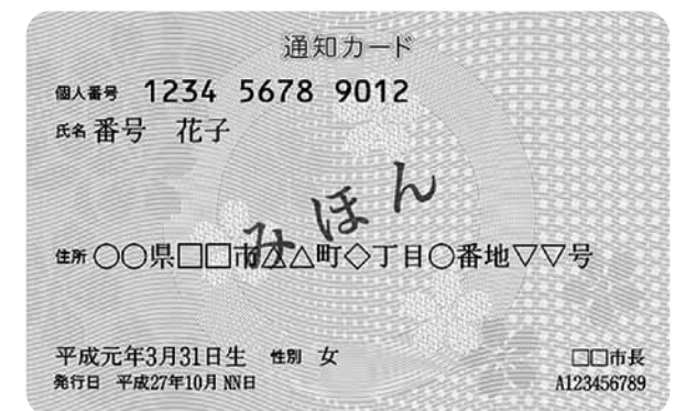
通知カード（表面）イメージ

通知カードは、本人に個人番号を通知するため及び個人番号確認のために発行されるものであって、本人確認書類として使えませんので、ご注意ください。 ※通知カードに記載されている住所や氏名に変更がある場合には、市役所窓口で手続きが必要です。