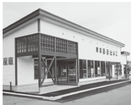
▲農産物等直売所「おおだいこ」

https://www.facebook.com/kitaakita.chiikiokoshi/