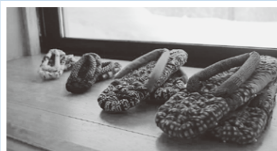
最近のマイブーム 『布草履作り』