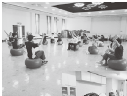
◀楽しく体を動かす「健康スポーツ講座」