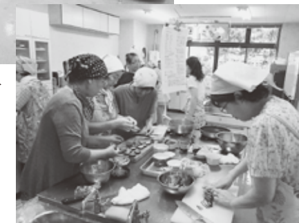
体の中から健康になる「薬膳料理教室」