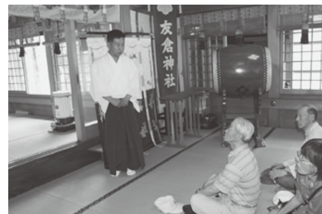
▲郷土の歴史を学ぶ「ふるさと歴史散歩」(阿仁公民館)