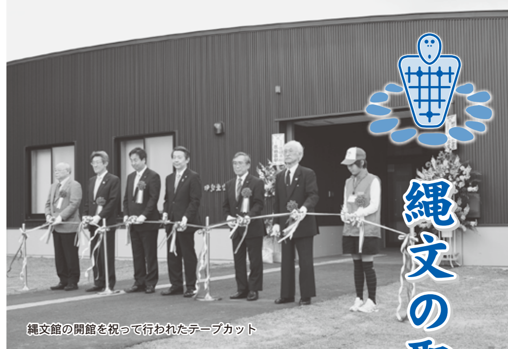
縄文館の開館を祝って行われたテープカット