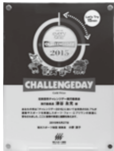
昨年獲得した金メダル