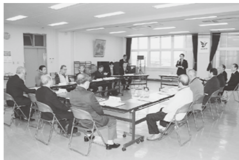
監視を強化していくことを確認した北秋田市廃棄物不法投棄監視委員会

市道はもちろん、林道、農道まで、市内全域を定期的にパトロールし、重点地域には監視カメラや看板を設置するなど、不法投棄の防止のために厳しい目を光らせています。