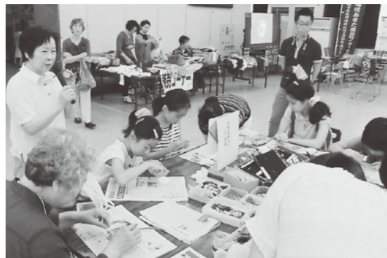
昨年エコフェスタの様子

鷹巣消費者の会主催の「北秋田市エコフェスタ」もそのひとつ。2012年から毎年開催され、環境への意識啓発に取り組んでいます。