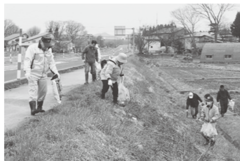
春のクリーンアップの様子

春のクリーンアップは多くのみなさまにご参加いただき、雪解け後のごみを一掃することができました。秋のクリーンアップは10月中旬を予定しています。