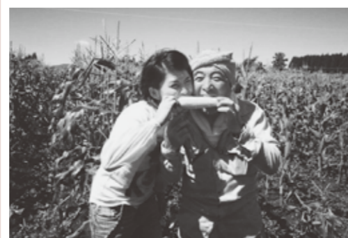
栄物産のとうもろこしネット販売

地域を歩き、北秋田市には美味しいものがたくさんあることを知りました。ですが、市外・県外の方々にはまだまだ知られていない・買える場所が少ないのが現状です。北秋田市の「食」をもっと知ってもらいたいと思い、先月号コラムで紹介した「おさるべふるさとパック」販売からヒントをもらいました。まずは、モニター商品として合川地区の「栄物産」さんにご協力いただき、先日初めて野菜のネット販売に挑戦してみました。