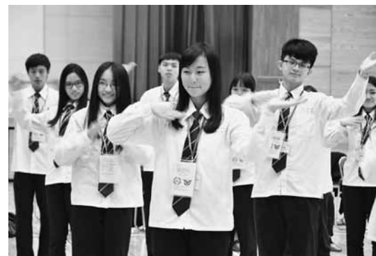
▲龍潭高級中学の生徒は全員で、星野源さんの「恋ダンス」を披露し交流を深める