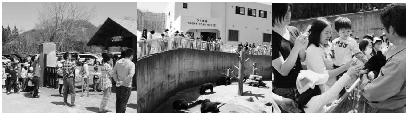
▲入場口は場外まで長蛇の列（阿仁くまぐま園）