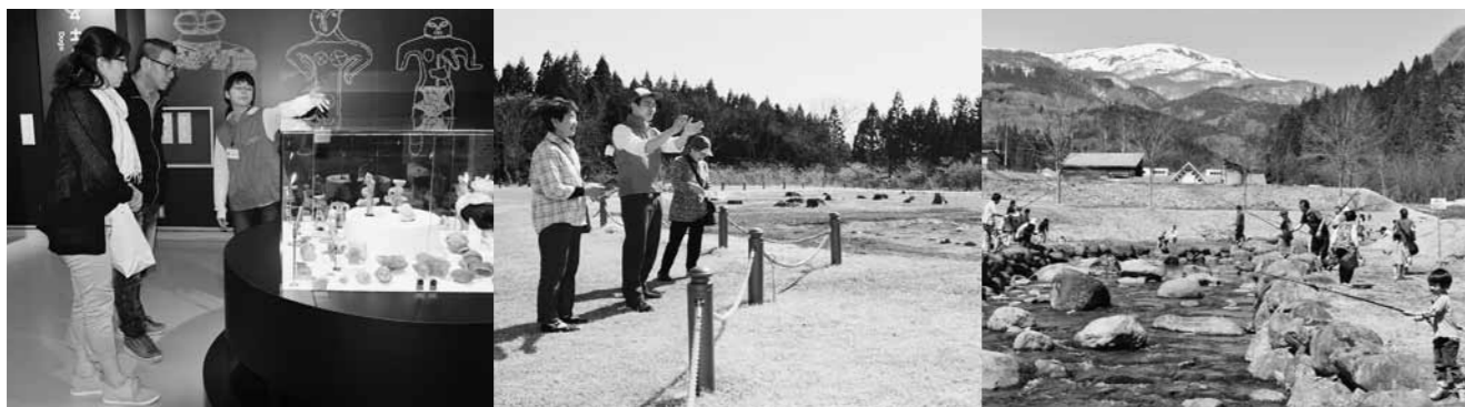
▲来場者に世界遺産を目指す遺跡の魅力を伝えたジュニアボランティアガイド（伊勢堂岱遺跡）