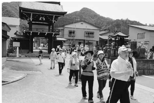
▲阿仁鉦山ゆかりの寺院を巡りながらウォーキングする参加者

阿仁鉦山ウオークが、6月29日に阿仁合地区で行われ、市民約90人が参加し、ウォーキングで健康増進を図りながら心地よい汗を流しました。 今回のウオークは、産銅日本一を誇った阿仁鉦山にゆかりのある寺院を巡りながら阿仁合地区を回るコース。この日は、好天に恵まれ絶好のウォーキング日和。参加者たちは、準備運動のあと阿仁山村開発センターをスタートし、コース途中にある善導寺や専念寺、善勝寺、法華寺などを巡り、それぞれの寺院の歴史や特徴を学びながら、思い思いのペースで汗を流し、心身をリフレッシュしていました。ウォーキングのあとは、昼食をとりながら参加者同士で親睦を深めました。