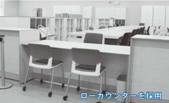
ローカウンターを採用