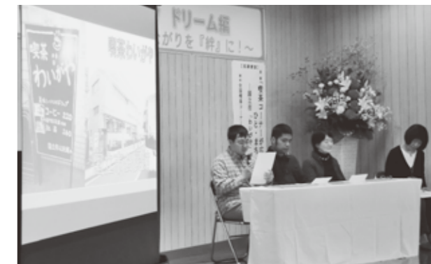
▲活動事例発表をする「ささえ」の皆さん

動中の皆さんが、夢の実現に向けた取り組みや課題を発表し、活発な意見が交わされました。