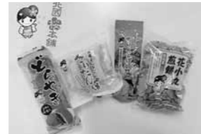
北国さくら本舗の商品

400社を超えるメーカー様から商品を仕入れ、スーパーマーケット、ディスカウントショップ、ドラッグストアなどの小売業様とのお取引をさせていただいております。自社ブランドの「北国さくら本舗」の商品も、好評発売中です。