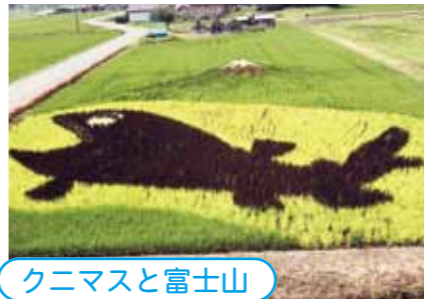
クニマスと富士山