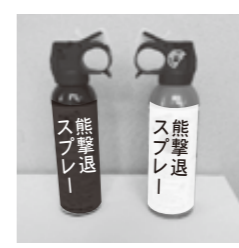
△市販の熊撃退スプレー