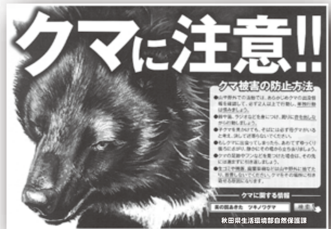
△県ではチラシを作成し注意を呼びかけています

秋田県では今年の2月22日、2018年度の県内のツキノワグマの推定生息数を2017年度の2300頭から1400頭多い3700頭と推定しました。 また、今年度はクマの食料となるブナの実が大凶作となっており、人里への出没が昨年以上に増える予想されます。クマが人里へ来る原因を作らないようにし、人とクマが出会わないようにしましょう。