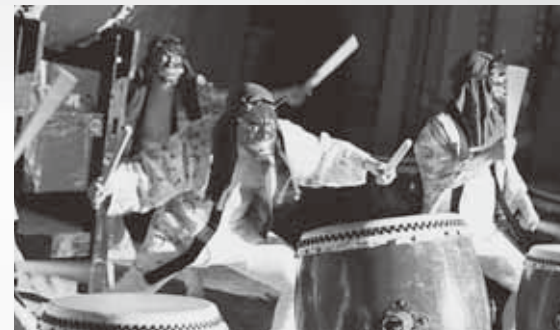
特別出演：鬼ノ國心鼓会