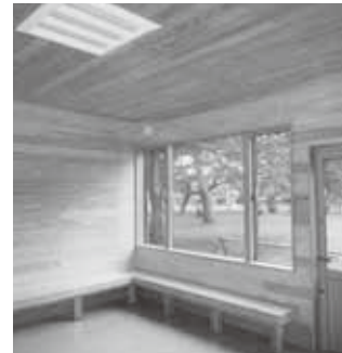
木の温もりを感じることが できる内部、木製のベンチ も設置

使用開始は9月1日から、24時間の利用が可能となります。(冬期12月から3月までは閉鎖) 中央公園におでかけの際は、ぜひご利用ください。 問合せ 都市計画課都市計画住宅係 ☎725246