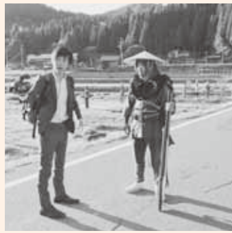
スーツさんによる撮影の様子

今回のYouTubeの動画内でも今回のコラムの内容にちょっと触れておりますので、ぜひ一度、ご視聴してみてください。また、動画を見る際はYouTubeの検索から「スーツ 旅行」(https://youtu.be/MrSQqumV7Dg)と検索してもいいと思います!!