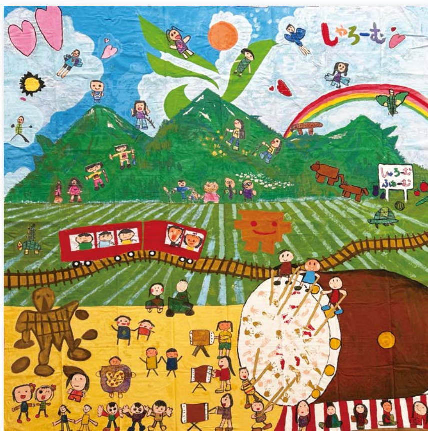
世界一大きな絵 EXPO2025出展 作：認定こども園 しゃろーむ園児と 市内関係者 絵の大きさ [5m×5m]

市民一人ひとりが学びを通じてつながり、支え合いながら、笑顔と希望に満ちた地域の未来をともに創ります。 この理念のもと、学校・家庭・地域が協働し、子どもから大人までが輝く「きらり北秋田」を目指します。