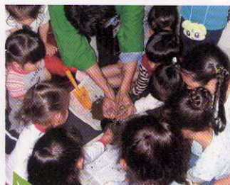
苗木のホームステイ