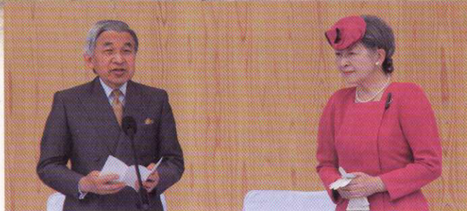
：天皇陛下の ：お言葉