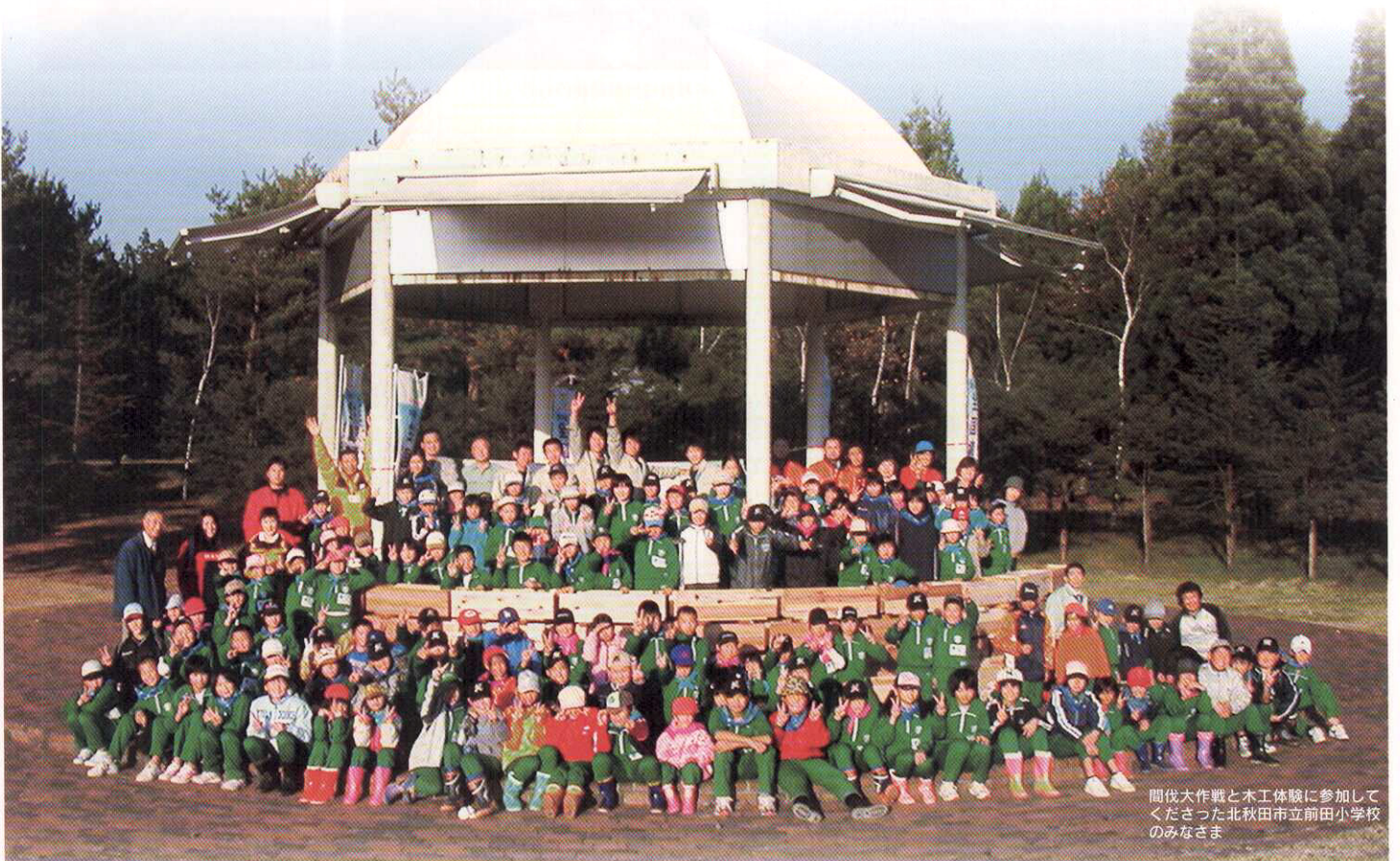
間伐大作戦と木工体験に参加して くださった北秋田市立前田小学校 のみなさま