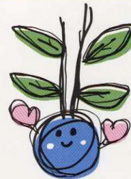
シンボルマーク 芽森(めもりー)