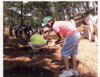
※写真は他県開催のもの