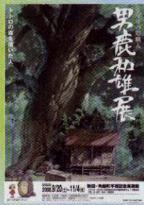
「となりのトトロ」背景画(1988年)©1988 二馬力・G/ 展覧会タイトル題字：鈴木敏夫(スタジオジブリ)