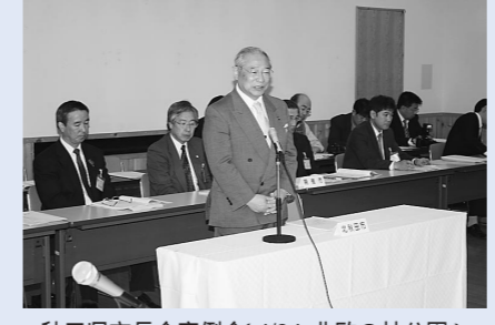
秋田県市長会定例会(4/24・北秋の杜公園)