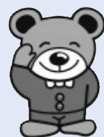
森吉のじゅうべえ