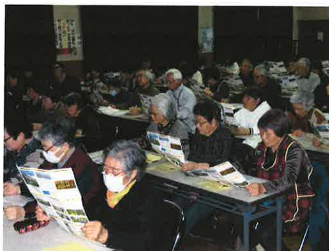
熱心に聞き入る参加者