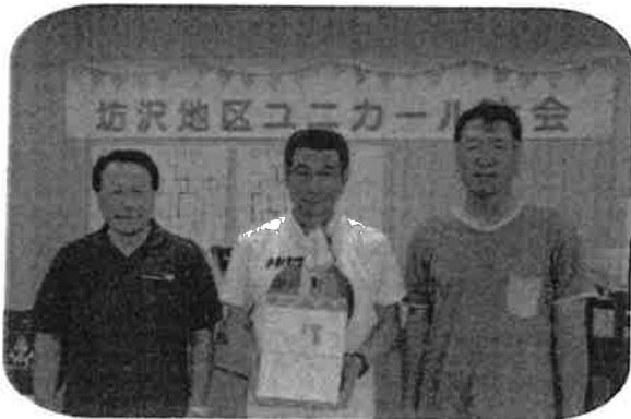
準優勝 相善町A 3位 相善町B