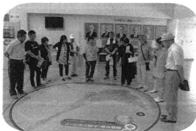
大潟村干拓博物館