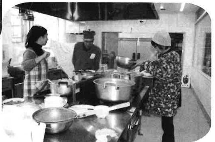
そばだしスタッフ →