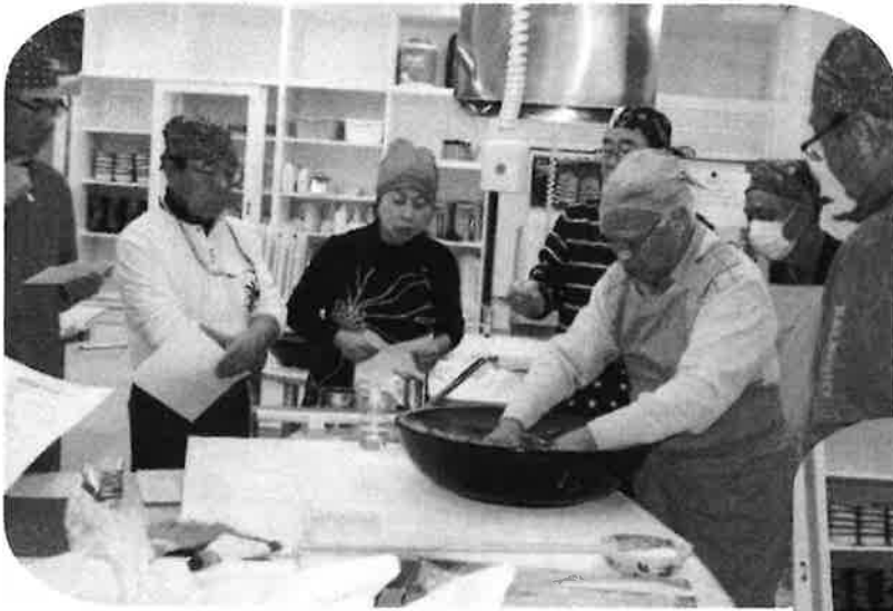
← 水回しと菊練りの模範

当日は、10人がそばうち体験にきて、道場の4人がそれぞれ体験の指導を行ないました。また、試食用のそばも打ち、50人以上の方々に打ったそばを食べてもらいました。試食も体験も大好評でした。