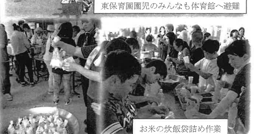
お米の炊飯袋詰め作業