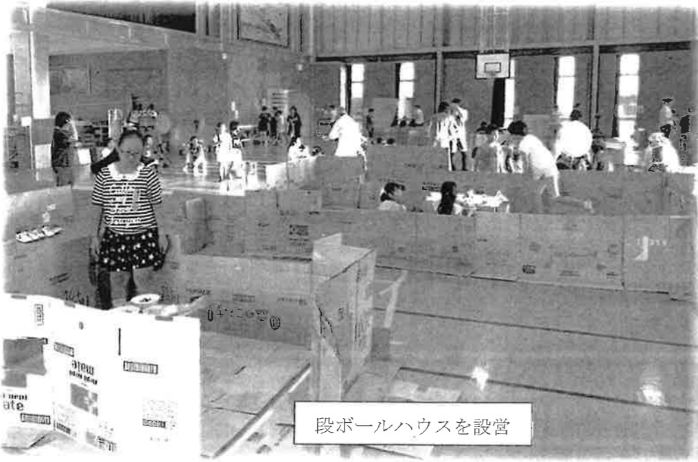
段ボールハウスを設営