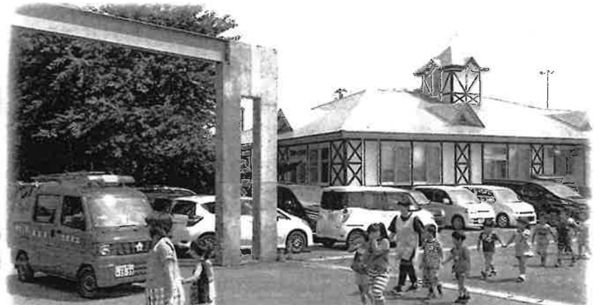
東保育園園児のみんなも体育館へ避難