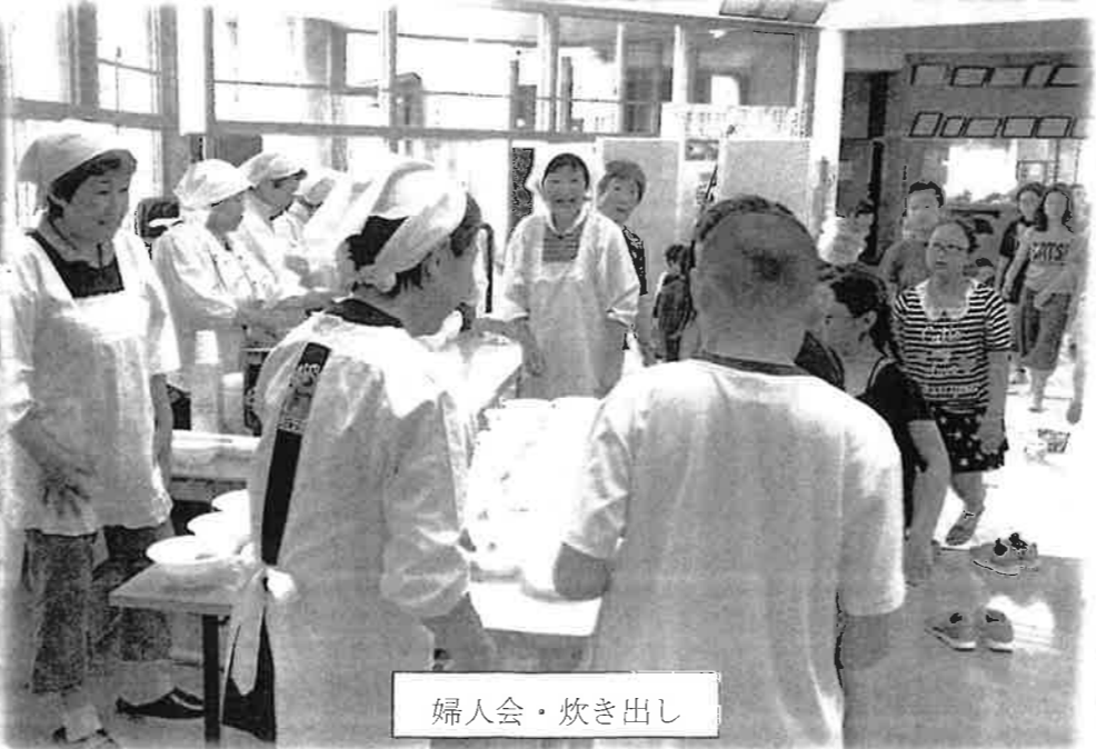
婦人会・炊き出し