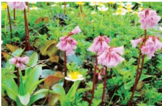
鷹巣阿仁地域季節スナップ 森吉山では、イワカガミ・チングルマなどの可憐な高山植物が花を咲かせております。