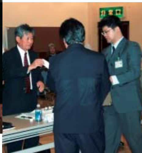
新市名について投票する 協議会委員の皆さん