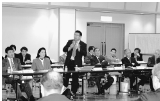
第2回協議会の様子