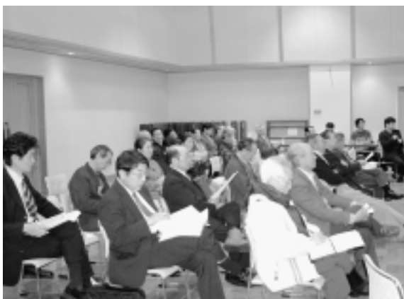
第2回協議会傍聴者の様子