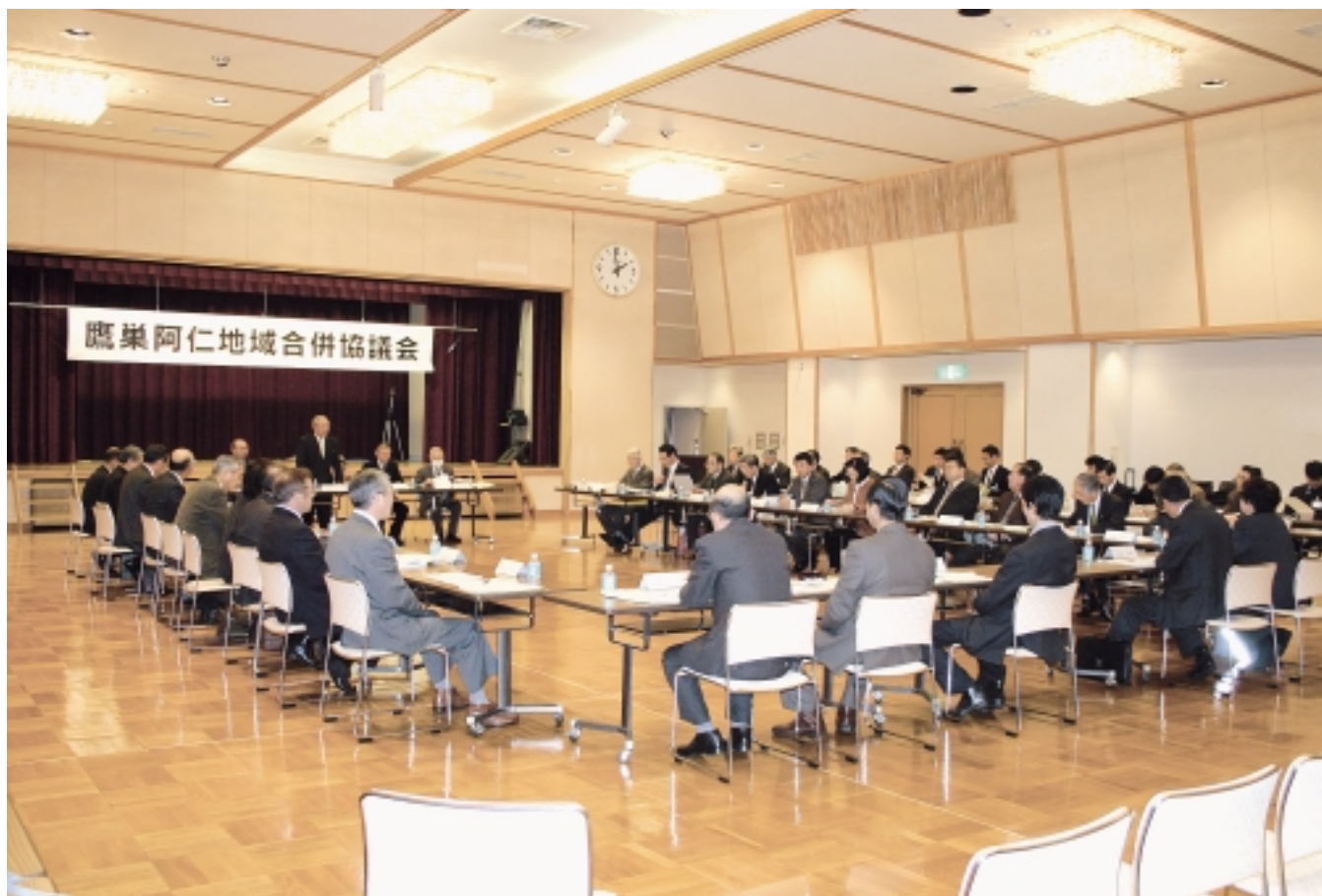
第2回合併協議会（阿仁町ふるさと文化センター）

3月2日、阿仁町ふるさと文化センターで2回目の協議会が開催されました。協議事項も、合併協定項目の協議などに移り、いよいよ本格的な協議が始まりました。