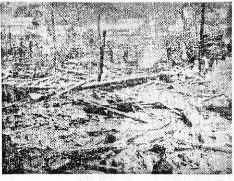
【写真】水無火災、上と大阿仁木材火災

百円以上の療養費を要する時、学校給食に基因する中校の全児童生徒二六七五人が加入し、外に保育所の幼児六十人が加入しておりま