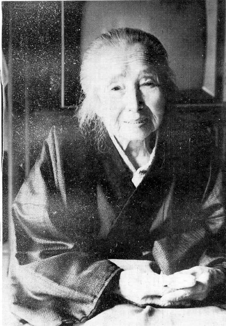
額のしわには、1世紀近い歴史の屈折がぎざまれている。