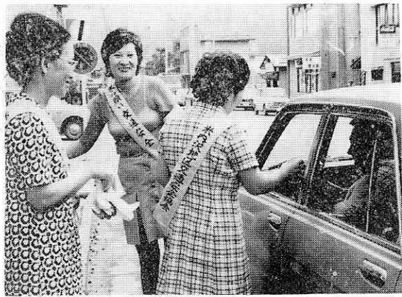
〔冷たいお茶で、ドライバーに無事故と安全運転を呼びかけ〕

「暑い中ごくろうさん、冷たいお茶をどうぞ、交通事故に気を付けて下さい」胸にタスキをかけ、ドライバーにお茶をサービスしながら、交通安全を呼びかけるのは、阿仁町商工婦人部のみなさん。