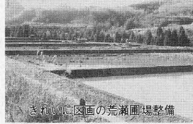
きれいに区画の荒瀬圃場整備