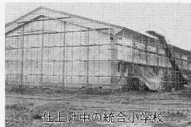
仕上げ中の統合小学校