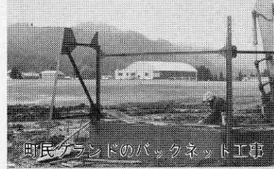
町民グラウンドのバックネット工事