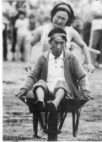
「かあちゃんしっかり」夫操従法

八月二十八日、阿仁一中グラウンドでのことしの町民体育祭は、雨の中の熱戦でした。 融和と協調をモットーとした体育祭も、ことしで十二回目をむかえ、今では町の年中行事としてすっかり定着しました。