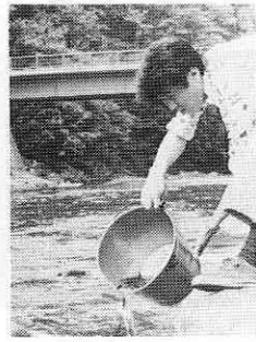
阿仁川の町内三カ所(専念寺川原、萱草橋、幸屋橋)にアユの稚魚一万五千匹を放流しました。