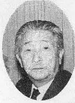
町長 沢井 作蔵

ご承知のとおり昨年は、国内外の経済不安で、相つぐ企業倒産などかつてない経済不況に明け暮れた一年でした。