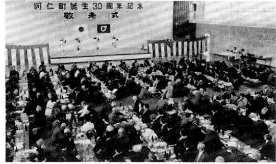
▶アトラクションに見入る出席者

今年度の町の敬老式が十三日、町民体育館で行われました。町内七十歳以上のお年より人口は七百十二名（九月十五日現在）で昨年より二十三名増え、全人口に対する割合も十二・四割と高齢者率が高まっています。この日は、昨年とほぼ同じ四百十二名の元氣なお年よりが出席しました。