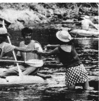
の飲んで、ガンパッテ」