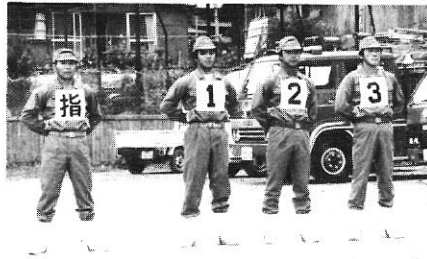
小型ポンプ操法三位の第11分団の選手

道路交通法の一部が改正され、主なものは九月一日以降段階的に施行されます。今回の改正は、ここ数年増え始めた死亡事故を減少させるとともに、車社会の新しい秩序づくりを目指すものです。主な改正点は次のとおりです。