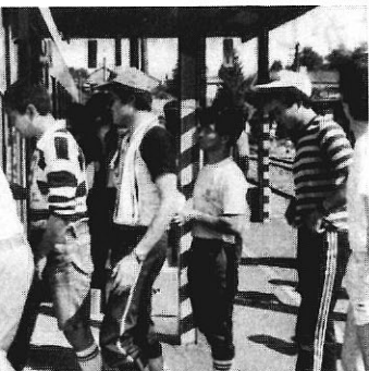
線で、出発点の比立内へ