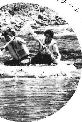
はトップの両菊地チーム

涼味満点のアドベンチャーレース、阿仁川下りゴムボート大会が十六日、県内外から九十六チーム、百九十名の選手多数が参加して行われ、阿仁川清流にさわやかな水しぶきがあがりました。