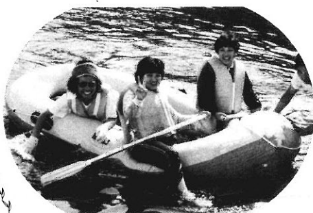
「もうクタクタヨ」 見事ゴールした女性三人組