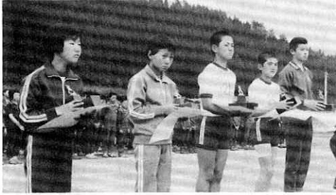
新記録を出し、表彰される選手たち