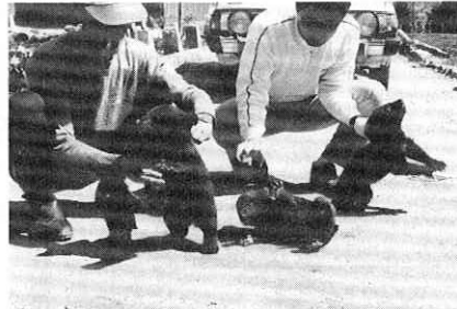
仲間が増えてごきげんの三頭の子グマ

先月号で紹介した子グマの袖子ちゃんは、食欲も旺盛でスクスクと育っていますが、このほど新しく二頭が仲間入りしました。