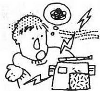
電波法違反防止旬間 6月1日～10日

▽本庁……6月4日(火) 午前8時半～午後5時 ▽支所……6月5日(水) 午前9時半～12時 ※妊娠証明書はいりません。