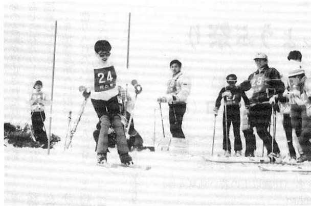
ジャイアントスラローム出発地点一前岳

等を使ったレクリエーションが始まり、標高千三百メートルの大雪原でそう快な汗を流しました。 太陽と雪からの強い日差しを浴びてすっかり日焼けしたみんなは、すばらしい眺望の森吉山に、一日も早いスキー場の実現を願いながら、楽しく昼食をとりました。 そして午後からは、ブナの樹間を縫うようにして滑り下りて、春山スキーツアーのさいご味を満喫しました。