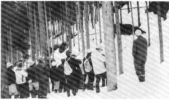
写真—間伐技術講習会

三月の集落座談会で説明しましたが、さらに広く皆様にお知らせするものです。また、個々の林家にも、後日ご相談することもありますのでよろしくお願います。