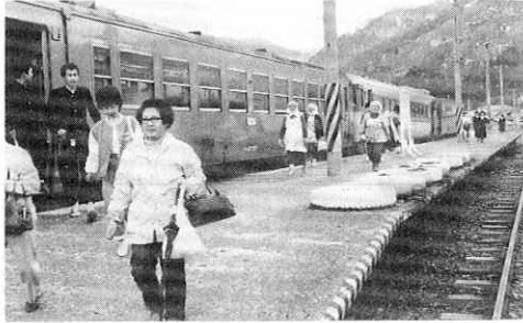
工事再開を待つ終点の比立内駅

私たちの足であり、地域開発にも欠かすことのできない鉄道―鷹角線の行方が注目されています。その鷹角線の、工事が凍結されている未開通部分(比立内―松葉間、二九・三き)について、国が