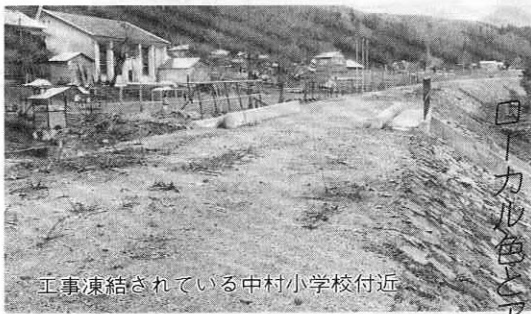
工事凍結されている中村小学校付近

初めて新線と認めたことから急進展を見せ、六十三年度末の全線開通をめざして年内にも工事再開のメドがつかうなど、具体的な動きが始まりました。