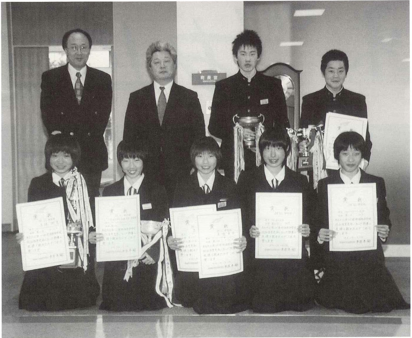
▲全県スキー大会で大健闘の阿仁中スキー部 東北・全国大会もがんばれ!!