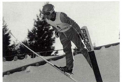
加賀選手が二冠達成!