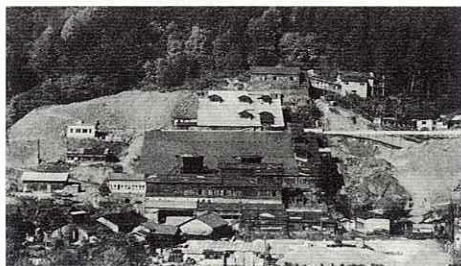
古河阿仁鉱山小沢選鉱場