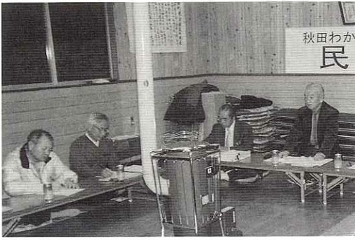
▶ 畑町児童館で行われた秋田わか杉国体民泊説明会

平成19年に行われる秋田わか杉国体で、当町はアーチエリー競技の開催地となっております。町国体準備室では、大会期間中に来町する選手、監督、競技役員等の宿泊受け入れの準備をすすめるため「民泊説明会」を開催し、町内各地区関係者らに民泊への理解と協力をお願いするにしました。