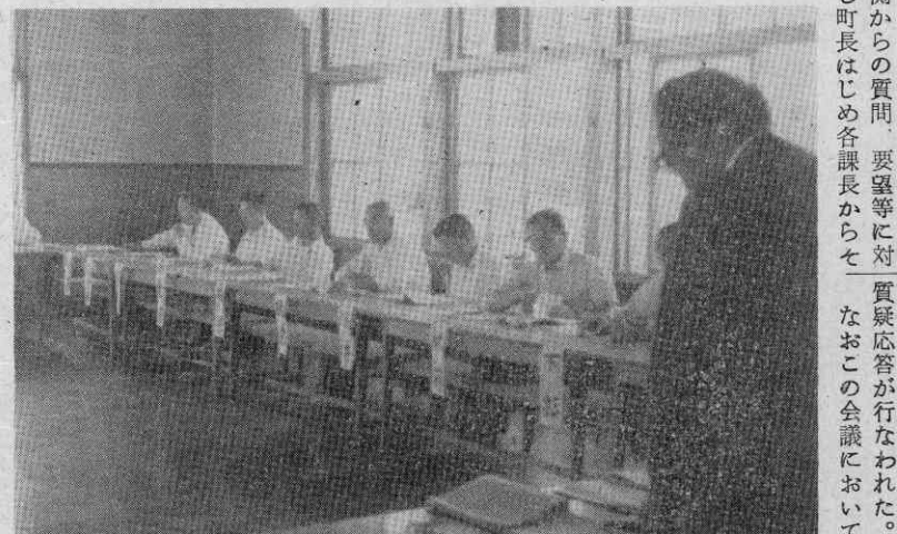
【写真は重点施策を説明する崑山町長】

今年度の町内部落代表者会議は、去る六月二十四日午後一時から役場会議室に各部落代表および町首脳部が参加して開かれた。会議は、崑山町長から、「町内各部落の絶大な協力によって町が町勢も着々伸展しており感謝にたえないが、今後とも物心両面から協力をお願いしたい」とのあいさつが述べられた。崑山町長は、今年度において重点的にとりあげている交通安全のない町づくり運動、火事を出さない運動、