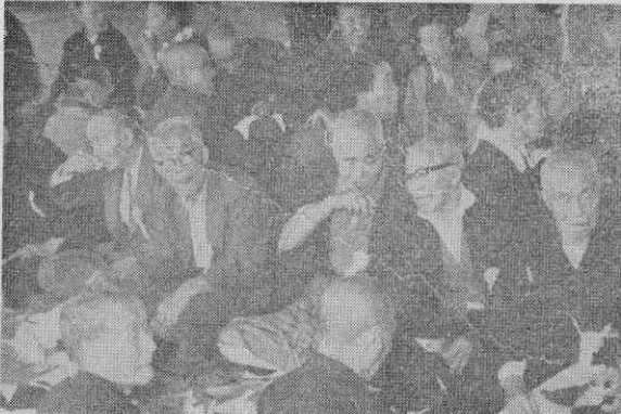
【楽しかった敬老会】