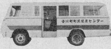
〔あたらしいマイクロバス〕