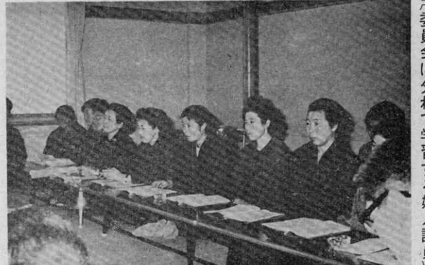
〔町長から町政の説明を聞く婦人議員〕〔委員会に分れて学習する婦人議員〕