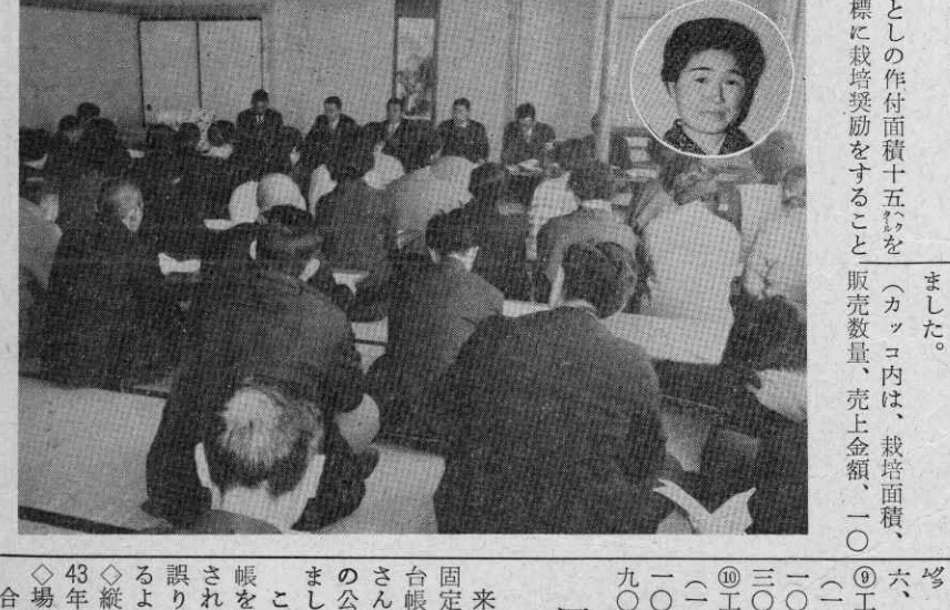
町議会議員選挙立候補予定者などからの要望もあるため、三月六日午後一時から役場会議室で「説明会」を開くことになっており、

町議選を主体としたものにして出す予定です。四年ぶり、三度目の広報編集を一月から担当しておりますが、できるだけみなさんに親しまれる紙面をつくるようがんばりますのでどうぞよろしく願います。