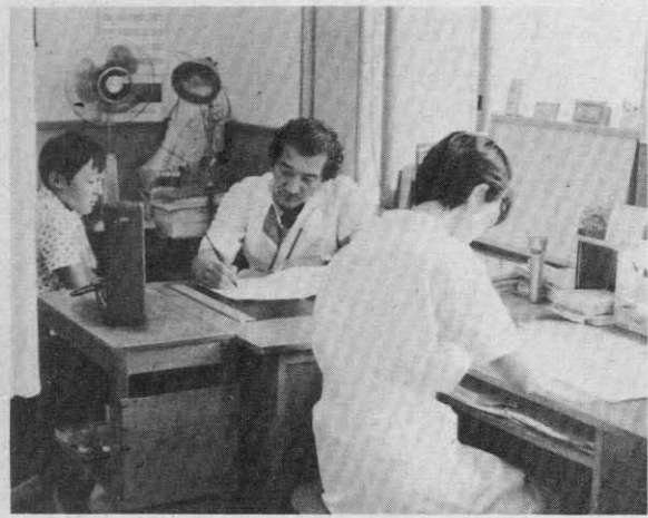
健康な町づくりの柱 合川町町民健康管理センター

この年度は、私の町長としての任期にもあたり、更なる誠心誠意をもって町政全般にあたる覚悟でありますので、町議会と町民の特段の指導と鞭撻をお願いして、私の施政方針といたします。