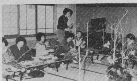
先生の指導を一つももらさずにと……その目も真剣(生花講座)

と実益をかね楽しく学んでいただくため、冬期町民講座を昨年の十二月から今年三月までの四ヶ月間にわたり開設しましたが、このほどそれぞれ盛況のうちに終了しました。