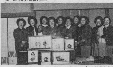
出来上った作品を前にパチリ(手芸講座)