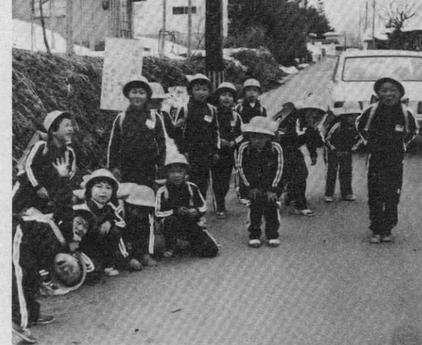
新入生だ!! ぼくたちゴミを捨てないよ。