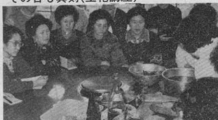
熱心に聞き入る……果してうまく行くかな(調理講座)