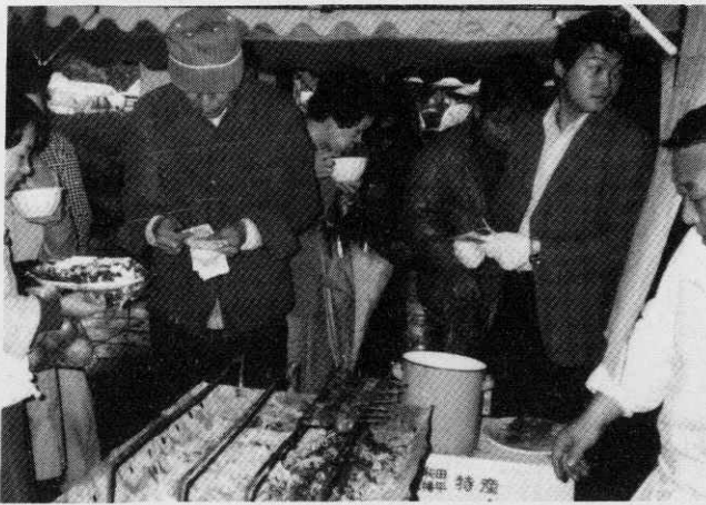
ヤツメのカバ焼きも登場。合川展は市民の中にしっかりと根を広げました。

「自分の家で食べるには少し多い。さつと(少し)だけ持って行ってけれ。」と、あつぎ会のみなさんが、トラックでかけつけると、裏の畑に、白菜がドツサリ自家用分を残して五十個ほどが積み込まれました。