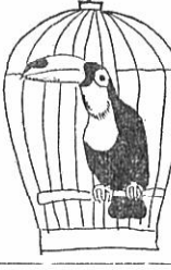
交通「一一〇番」制で事故の絶滅へ